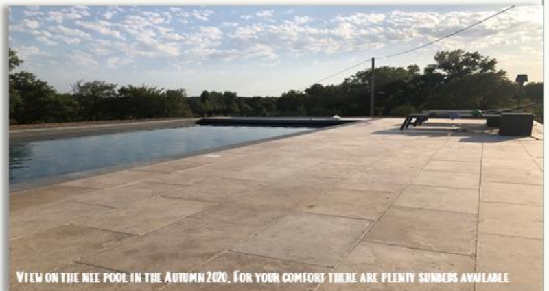
VIEW ON THE NEW POOL IN THE AUTUMN 2020. FOR YOUR COMFORT THERE ARE PLENTY SUNBEDS AVAILABLE

EIN NEU INSTALLIERTER SALZWASSERBEHEIZTER POOL 11x5MTR MIT AUTOMATISCHER ISOLIERENDER ABDECKUNG UND SONNENLIEGEN-TERRASSE WIRD ZU IHREM KOMFORT VON DEN BEIDEN HÄUSERN GETEILT. VOM POOL AUS GENIEßT MAN EINEN SCHÖNEN BLICK ÜBER DAS TAL.