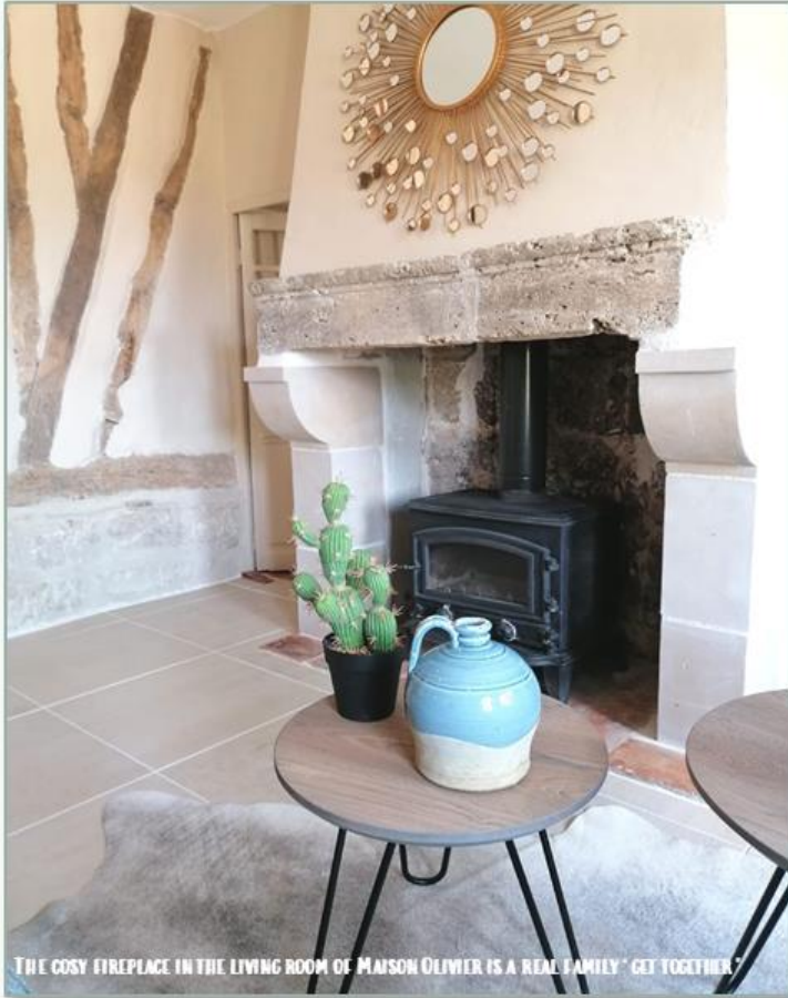
THE COSY FIREPLACE IN THE LIVING ROOM OF MAISON OLIVIER IS A REAL FAMILY "GET TOGETHER"