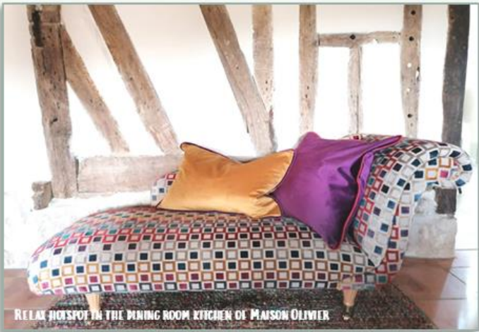
RELAX HIGHLIGHT IN THE DINING ROOM KITCHEN OF MAISON OLIVIER