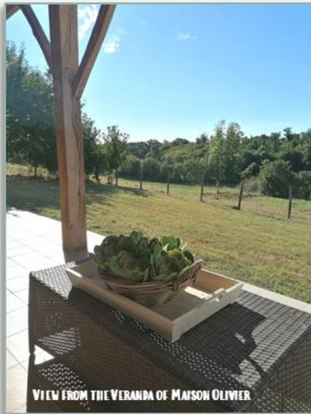
VIEW FROM THE VERANDA OF MAISON OLIVIER