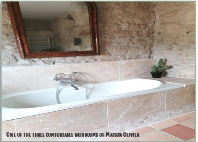
ONE OF THE THREE COMFORTABLE BATHROOMS OF MAISON OLIVIER