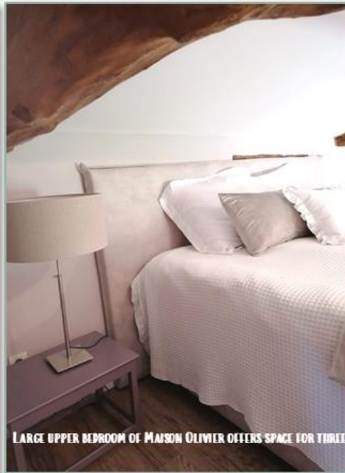
LARGE UPPER BEDROOM OF MAISON OLIVIER OFFERS SPACE FOR THREE