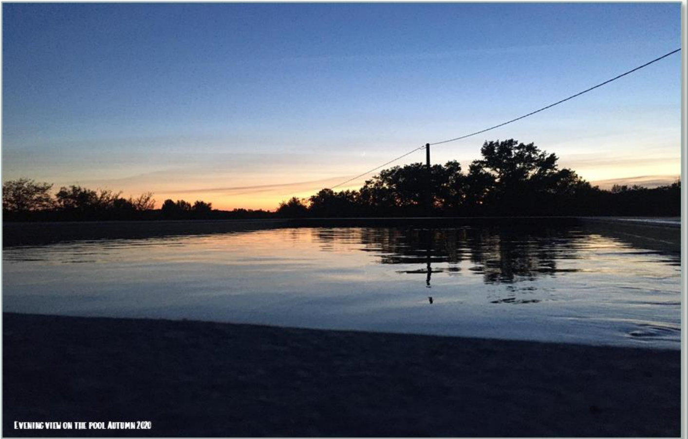
EVENING VIEW ON THE POOL AUTUMN 2020