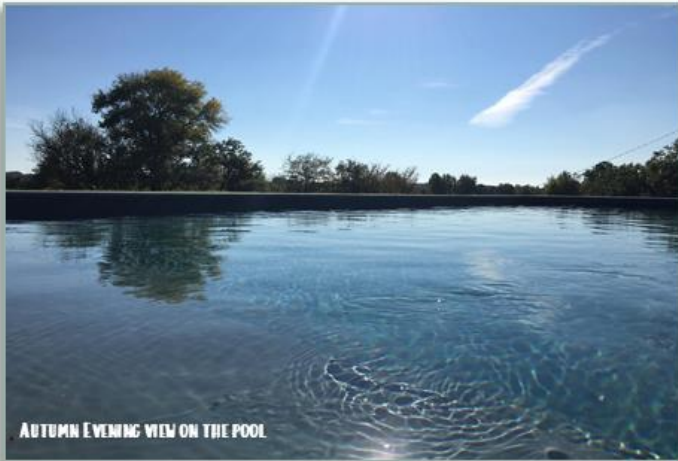
AUTUMN EVENING VIEW ON THE POOL