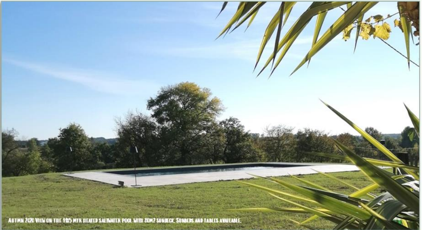
AUTUMN 2020 VIEW ON THE 18x5 MTR HEATED SALTWATER POOL WITH 20M2 SUNDECK. SUNBEDS AND TABLES AVAILABLE.