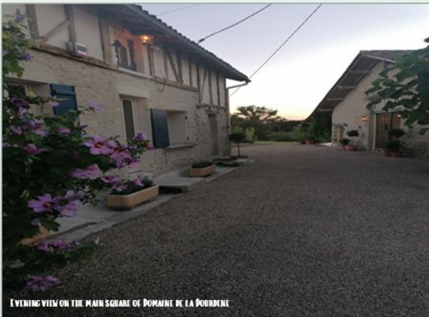
EVENING VIEW ON THE MAIN SQUARE OF DOMAINE DE LA POURDENE