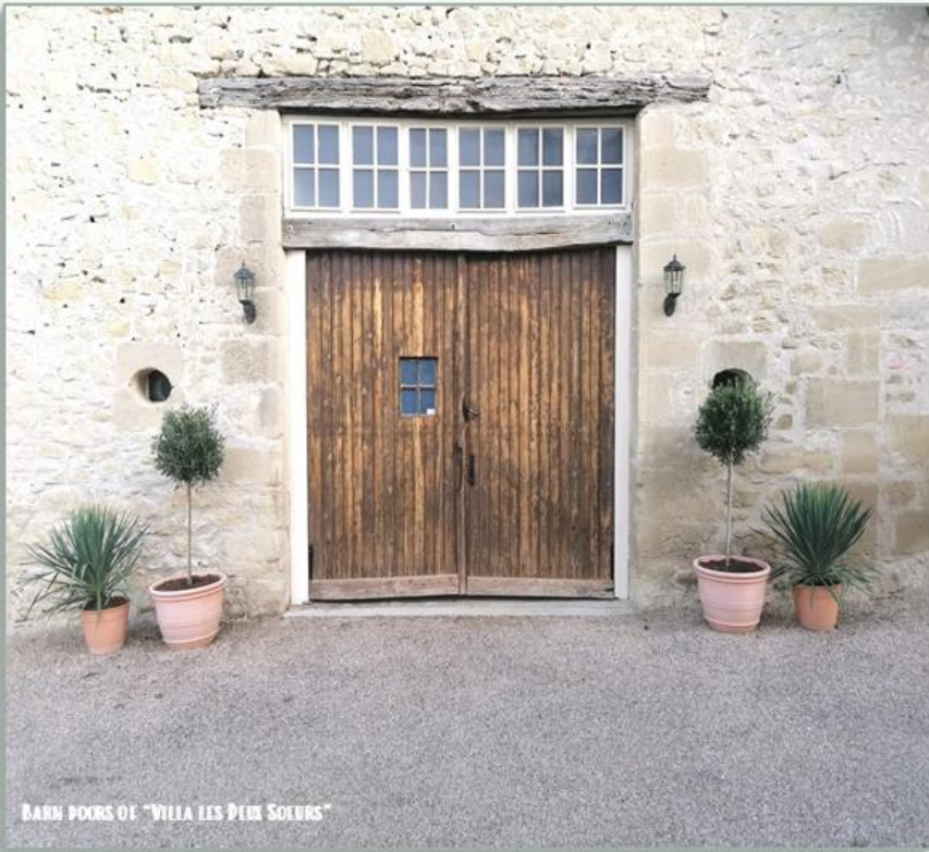
BARON DOORS OF "VILLA LES DEUX SOEURS"