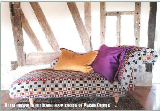
RELAX HOTSPOT IN THE DINING ROOM KITCHEN OF MAISON OLIVIER